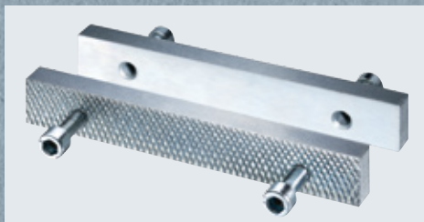
Visão geral dos mordentes de substituição